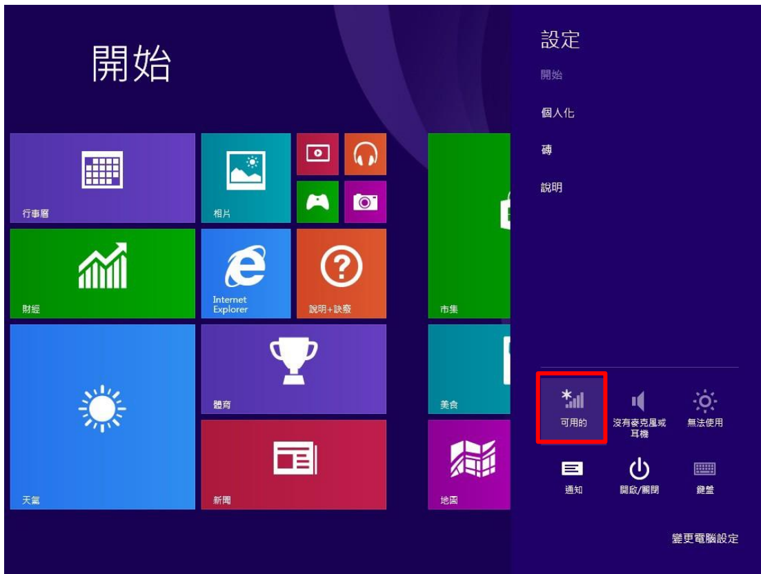
圖 2:點選【無線網路連線程式】